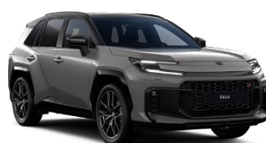
Argintiu/ Negru*** (M38)