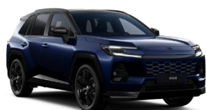
Albastru inchis/ Negru*** (M40)