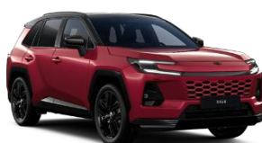
Rosu/ Negru*** (2NF)