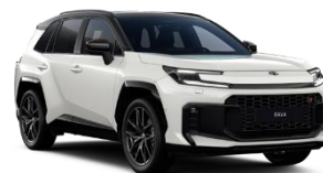
Alb platinum perlat/ Negru*** (2VP)