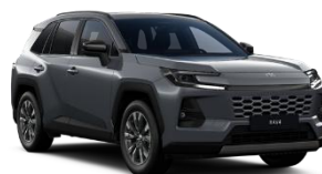
Gri inchis* (1L6)