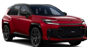
Rosu aprins/ Negru*** (2TB)