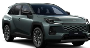
Verde inchis* (6X7)