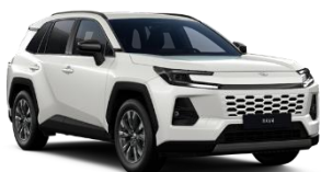
Alb Platinum Perlat** (089)