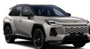
Bronz/ Negru*** (2SQ)