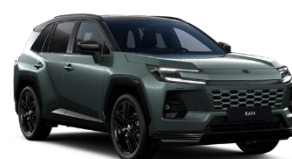
Verde inchis/ Negru*** (M39)