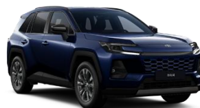
Albastru inchis* (8X8)