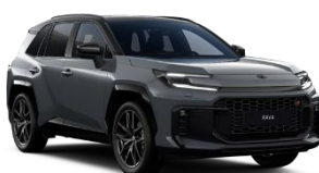
Gri inchis/ Negru*** (M22)