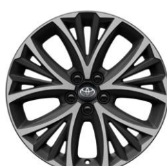
Jante din aliaj de 17" negre, cu aspect forjat (10 spite duble)