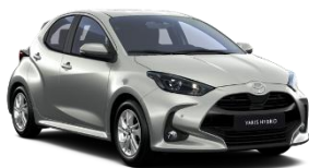
Gri deschis* (1K3)