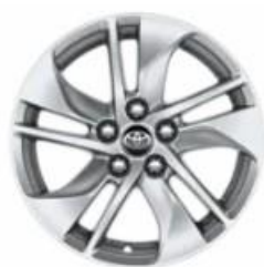
Jante din aliaj de 15" argintii (5 spite duble)