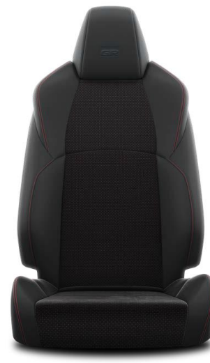
Piele intoarsa + partial piele (EB20)