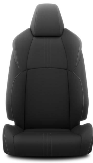
Stofa neagra cu cusatura gri (FD20)