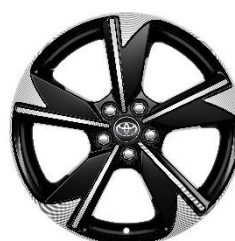
Jante din aliaj de 17" negre, cu aspect forjat (5 spite duble)