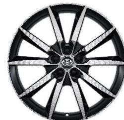
Jante aliaj 18" negre cu aspect forjat (10 spite)