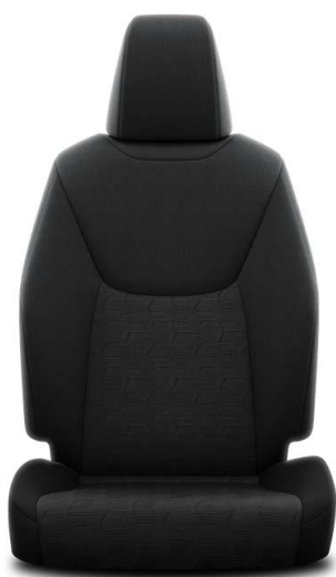
Stofa neagra (FB20)