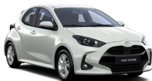
Alb perlat** (089)