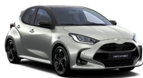
Bi-Tone gri deschis (1K3) si Negru (202)* (2TH)