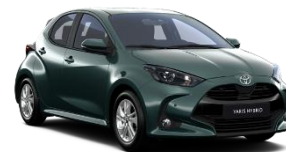
Verde forest* (6X7)