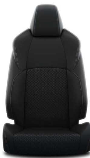
Stofa neagra + partial piele (EA20)