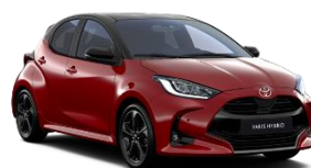
Bi-Tone Rosu aprins (3U5) si Negru (209)** (2SZ)