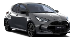
Bi-Tone Gri inchis (1M2) si Negru (202)* (M29)