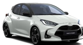
Bi-tone Alb perlat (089) si Negru (209)** (2PU)