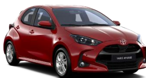
Rosu Aprins** (3U5)