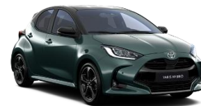
Bi-Tone Verde forest (6X7) si Negru (202)* (M39)