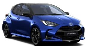
Bi-Tone Albastruienupar (8Y8) si Negru (202)* (M20)