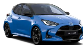
Bi-Tone Albastru Neptun (8T6) si Negru (202)* (M19)