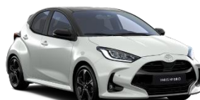
Bi-tone Alb perlat (089) si Negru (209)** (2PU)