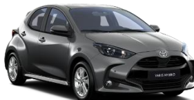
Gri inchis* (1M2)