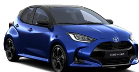
Bi-Tone Albastru ienupar (8Y8) si Negru (202)* (M20)