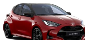
Bi-Tone Rosu aprins (3U5) si Negru (209)** (2SZ)