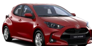
Rosu Aprins** (3U5)