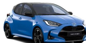
Bi-Tone Albastru Neptun (8T6) si Negru (202)* (M19)