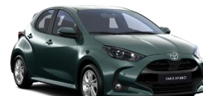
Verde forest* (6X7)