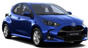
Albastru ienupar* (8Y8)