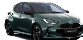
Bi-Tone Verde forest (6X7) si Negru (202)* (M39)